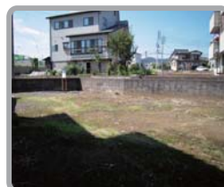
東側後方からの様子