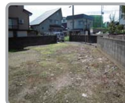
北側後方からの様子