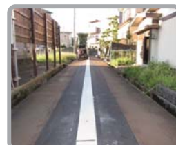
消パイ付の前面道路