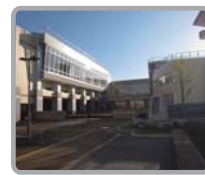
徒歩16分の小千谷小学校