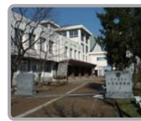
徒歩17分の小千谷中学校