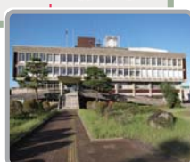
小千谷市役所へは徒歩4分